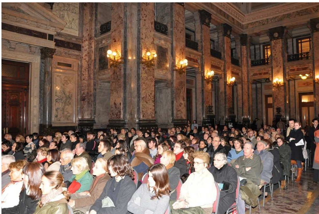
Concierto final de la Segunda Edición del festival, en julio de 2009. Salón de los Pasos Perdidos, Palacio Legislativo.